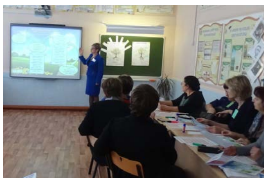
Начальный этап квеста

При обсуждении мероприятия педагоги и специалисты отметили, что мероприятие, проходившее в нетрадиционной форме, было организовано на высоком уровне, прослеживается системность в работе с родителями детей с ОВЗ.